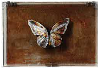
ワンダーシード2011入選作品