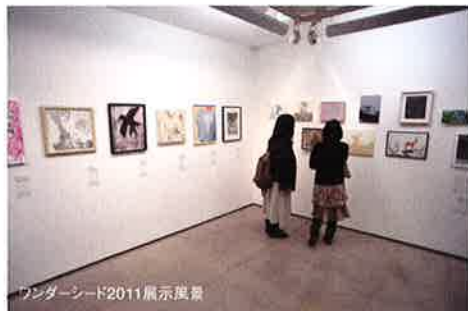
ワンダーシード2011展示風景

2011年は800点の応募があり、その中から選ばれた120点をトーキョーワンダーサイト渋谷にて展示しました。本年も多数の応募より選出された、約100点の入選作品を紹介します。