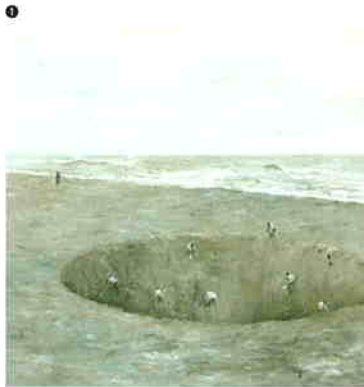
① 《THE COMPANY》2001 油彩、カンヴァス、130×130 cm