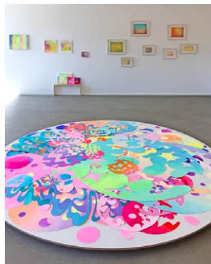
Open studio at Atelier Mondial · 2018

Support from: Atelier Mondial, KANEKA CORPORATION, Tokyo Arts and Space (TOKAS)