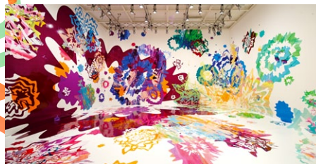
Ringing · 2010

Asae Soya is an artist from Yokohama, Japan, who creates paintings, installations and movie installations on the themes of light, color, and physical sensation. Her works are always focused on the human senses and their mechanisms. Soya gives forms to scenes born from her synesthetic experiences, such as when she hears sounds from colors. This solo exhibition, "Broken Rainbow," includes her new cutout installation, which was inspired by the light in Basel; oil paintings; and groups of drawings in pastels. The space filled with light and color will not only awaken our visual senses but all the five senses. Asae Soya obtained a Ph.D. from the Tokyo University of the Arts. She has held a great number of exhibitions, including her solo show at the Contemporary Art Center, Art Tower Mito (Japan).