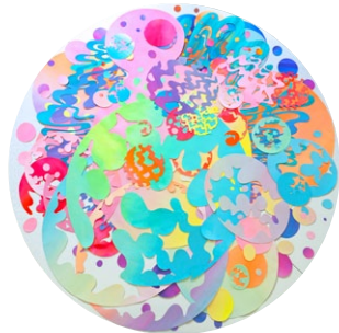
Broken Rainbow · 2018

Vernissage: 21. Juni, 19 Uhr mit Sake und Sushi-Party!