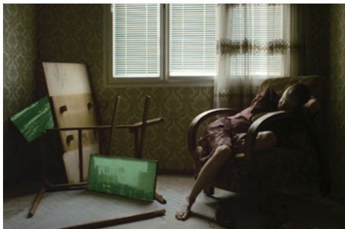
Installation Film «Baba Vanga»

会期：2016年11月26日（土）－12月3日（土）11:00 - 19:00（11月28日（月）は休館） ※開館中いつでもご覧いただけます。 | 料金：無料