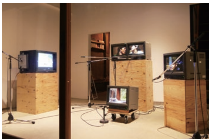
《男と女のエコー》2015 © 東山アーティストプレースメントサービス (HAPS) (参考画像)