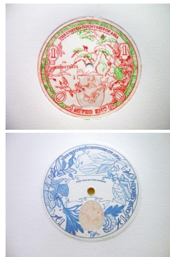
2. 照屋勇賢《Asian Money》(表・裏), 2006 Yuken Teruya, Asian Money (Front)/(Back), Edition: 100, 2006