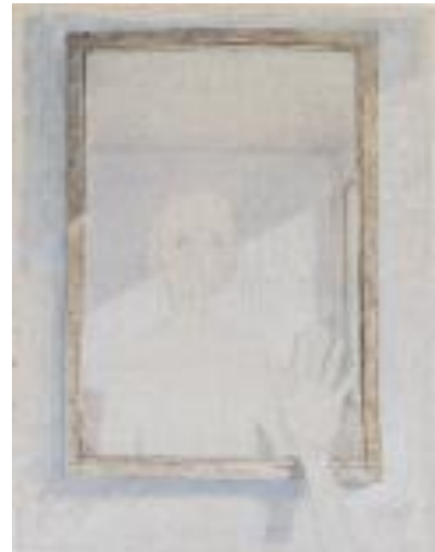
神 祥子 《ふれる》2016 油絵の具、色鉛筆等、麻布