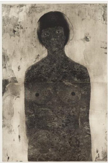
黒石美奈子 《Circulation》2016 エッチング、アクアチント、雁皮紙