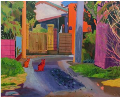
渡部仁美 《待ち合わせ》2016 油彩、アクリル、キャンバス