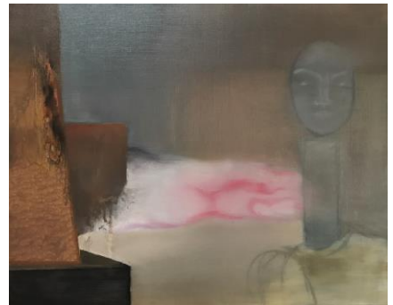
石井佑果 《numanuma沼アンドミー》2015 油彩、キャンバス