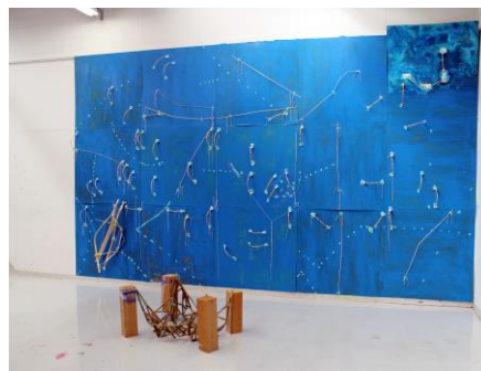
伊藤夏実 《天動説 動作の中心を捉える》2016 竹、画紙、油性ペンキ、ベニヤ板