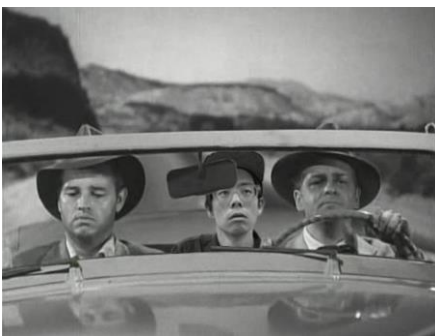
山内祥太 《恐怖の回り道》2017 ビデオインスタレーション