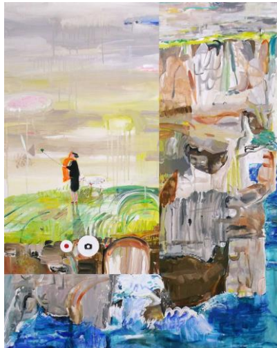
林 菜穂 《見ている人を見ている人》2016 アクリル、パネル