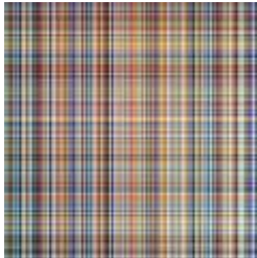
黒田恭章 《全ての他者たち》(部分) 2017 絹糸、植物染料、サイコロ