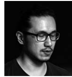
チェン・イーシュアン CHEN I-Hsuen [台湾 | Taiwan] 写真、映像 Photography, Film