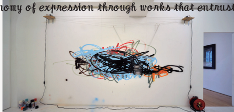
《「落書き」のための装置》2011 A Device for "Graffiti", 2011

Artist. Born in 1984 in Kanagawa. Graduated with an MA in Information design from Tama Art University. Explores the physicality of the human body and the autonomy of expression through works that entrust actions to autonomous devices.