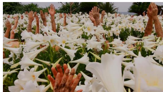
4. 《土の人》2016、3面ハイヴィジョン・ビデオ・ インスタレーション