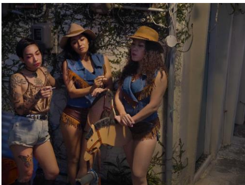
3. 《チンビン・ウェスタン 家族の表象》2019、 ビデオ

近年の主な展覧会に「話しているのは誰？現代美術に潜む文学」（国立新美術館、東京、2019）、「Asia Pacific Breweries Foundation Signature Art Prize」（シンガポール美術館、2018）、「あいちトリエンナーレ 2016」（旧明治屋栄ビル、名古屋）、「第2回恵比寿映像祭～歌をさがして～」(東京都写真美術館、2010)など。受賞歴に「第64回オーバーハウゼン国際短編映画祭」ゾンタ賞（2018）、「Asian Art Award 2017 supported by Warehouse TERRADA」大賞など。