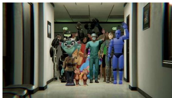
1. 《Unknown Friends》2023

「アセット」と呼ばれる、インターネット上で取引される素材データたちがいる。彼らはデジタルプロダクションにおける素材であり、俳優であり、労働者である。本展では不条理文学を参照しながら、イメージの生産と流通の中で変形する「アセット」を撮影する。不条理文学が変形する身体を思考したように、ありえた存在としての「アセット」を通じて現代における「変形譚」を立ち上げる。