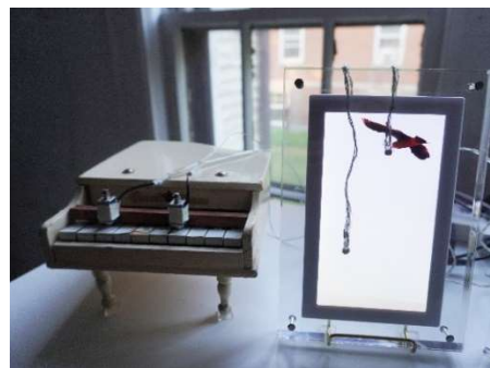
6. 《鳥には国境はない》2023 ハーベストワークス、ガバナーズ島、ニューヨーク

2022 年後半から 2023 年前半にかけて行われた 5 ヶ国への滞在と、それに伴うリサーチをもとに、ポスト・コロナ時代における移動の自由について考察する。ニューヨーク湾の検疫島や、台湾道教における日本人神廟を巡る幽霊譚、各国の渡り鳥の軌跡をベースに、古典的な通信技術を転用しながら不可視の存在を呼び起こす。