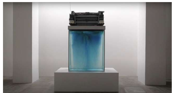
5. 《Soul Reclaim Device ("A portrait of my departed sister")》2018

AIによって今後人類の生存データは永遠にリサイクルされ続け、死後もデータが生き続けることになった。そして私たちは忘れたことも、忘れられたことも、思い出せなくなっていく。写真に刻まれた記憶を彫刻的に立ち上げながら、失われた記憶を実体として表出させ、記憶と記録の境界線を曖昧にすると共に、現代における存在、記憶、死の在り方を問う。