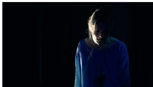
7. 『Well Temperament』2021

歴史的な事象に関連する道（近年はロックダウン中のロンドン市内のリージェンツ運河沿いなど）を探し、その道筋をランニングしながらフィールド・レコーディングした音源を使って、さまざまな時間と記憶を重ねていく即興パフォーマンス。また地図上でスコアを作り、地図とテリトリーの関係パフォーマンスをとおして考える。