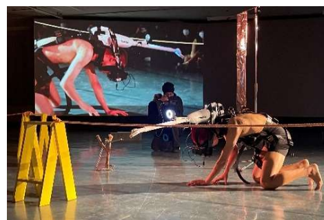
8. 『A Garden of Prosthesis』 EASTEAST_TOKYO, 2023

人間を中心とした世界を反転させ、他物のためにある人間の肉体についての可能性を考えるパフォーマンス。この《庭》では、人工物、自然物、肉体が等価に存在し、《庭師》たちによってそれぞれが互いに《接木》され、侵犯し合う。それぞれのオブジェクトは、互いが互いを義肢とし、やがて人間さえも植物や機械の義肢となることで、オブジェクト同士の関係は氾濫し、この人間社会において定義づけられた機能や存在意義を逸脱した可能性のキメラとして癒着する。そして、それらが矛盾しながら調整しあうことで共存し、その《庭》は造られ続ける。