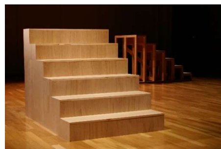
9. 『6steps』

TOKAS に置かれた 6steps (6 段の階段／振付／舞台装置) と、6steps を踊るための振付書／指示書により、来場者は自由にそれを上り下りしながらダンスを探ることができる。また会場内には、6steps のコンセプトと振付を担当する木村玲奈が、ひとりで、時々誰かと踊っているかもしれない。来場者は実際に体験することも、少し距離をとって眺めることもできる。