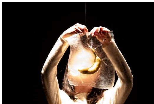
3. 『SO LONG GOODBYE』2020