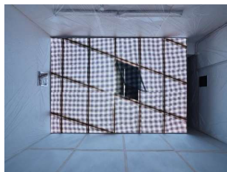
2. マーク・チュン《デッドエンド #1》2021

河井朗が主宰・演出する実演芸術を制作するカンパニー。近年は年齢職業問わずインタビューを継続的に行い、それをコラージュしたものをテキストとして扱い上演を行う。その他にも既成戯曲、小説などのテキストを使用して現代と過去に存在するモラルと、取材した当事者たちの真実と事実を織り交ぜ、実際にある現実を再構築することを目指す。