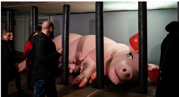
3. 「Dark Mofa 2019 『Pigpen』」公演風景 (Avalon Theatre、ホバート、オーストラリア)