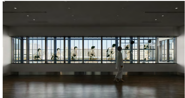
6.《東京仕草》2021「Back TOKYO Forth」展示風景 (東京国際クルーズターミナル、2021)