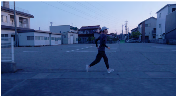
7.《so far, not far》よりスチル画像 2023