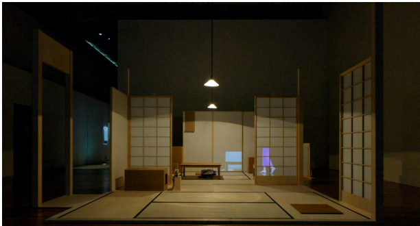
5.《東京仕草》2021/2023「ICC アニュアル 2023 ものごとのかたち」展示風景 (NTT インターコミュニケーション・センター [ICC]、東京)

この展覧会は、ポスターが剥がれてるのを見つけた時に、そっと貼り直すような、しなくてもいいことだけど、気づいたことに働きかけた延長にあります。