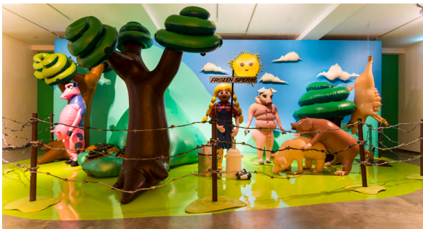
1. 「Ultra Unreal」展示風景 (シドニー現代美術館、2022)