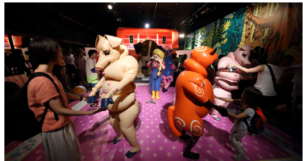
2. 「あいちトリエンナーレ 2019 情の時代『House of L』」公演風景 (愛知県芸術劇場、名古屋)