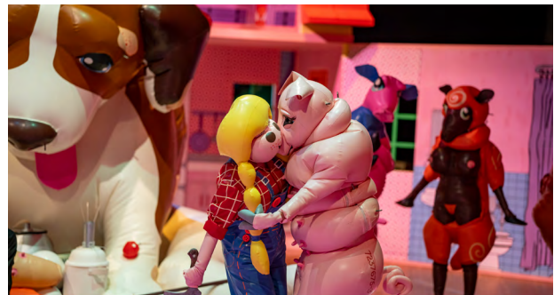
4. 「Cycle of L」公演風景 (高知県立美術館、2020)