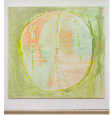
5. 《Roulette#3 (R.I.P Lou reed)》2023

1991年湖北省（中国）生まれ。2019年東京藝術大学大学院美術研究科絵画専攻油画修了。主な展覧会に「Take me to the river」(Yutaka Kikutake Gallery、東京、2026)、「project N 98」(東京オペラシティアートギャラリー、2025)など。