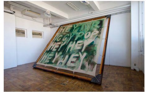
6. 《No title (Hay Mr. Iggy Pop)》2017