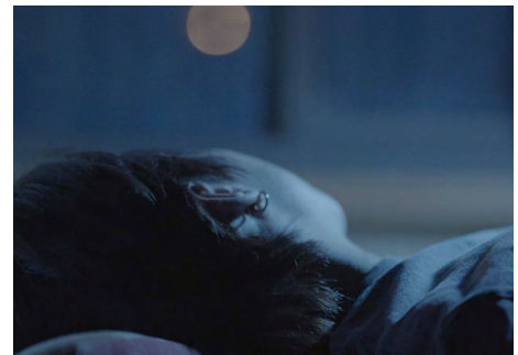
7. 《近づくまで — 見えたその先は》2025

1998年上海生まれ。2025年東京藝術大学大学院美術研究科先端表現専攻修了。主な展覧会に「例えば（天気の話をするように痛みについて話せば）」(東京藝術大学大学美術館、2025)、「前橋映像祭」(裏の間 [re/noma]、2025)など。主な受賞歴に「きみの海南映画祭 [映像研究祭]」八竹賞 (2025) など。