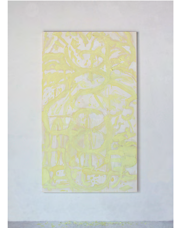
9. 《地表（光）》 2025

1991年和歌山県生まれ。2023年京都市立芸術大学大学院美術研究科絵画専攻油画修了。主な展覧会に「ALLOS and ERGON」(POOL SIDE GALLERY、石川、2024)、「Kyoto Art for Tomorrow 2024 一京都府新鋭選抜展一」(京都文化博物館)など。主な受賞歴に「京都府新鋭選抜展」ゲート・インスティテュート・ヴィラ鴨川国際交流賞(2016)など。