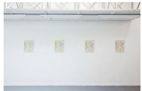
10. 《from side window (two ellipses)》 2021-2023