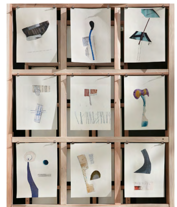
12. 《Setting a Ladder, a Circle is Forming》 2024-