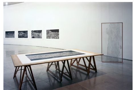
4. 「時に潜る」展示風景、2023