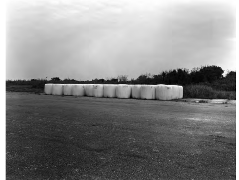
1. 《okinawan silence – cracked departure》2025

1991年沖縄県生まれ。2024年横浜国立大学大学院都市イノベーション学府都市イノベーション専攻博士後期課程単位取得後満期退学。主な展覧会に「遠い窓へ 日本の新進作家 vol. 22」(東京都写真美術館、2025)、「聞こえないように、見えないように」(Yumiko Chiba Associates、東京、2025)など。主な活動に「城崎国際アートセンター アーティスト・イン・レジデンス・プログラム」(KIAC、兵庫、2023)、主な受賞歴に「VOCA展 2026 現代美術の展望－新しい平面の作家たち」VOCA 奨励賞など。