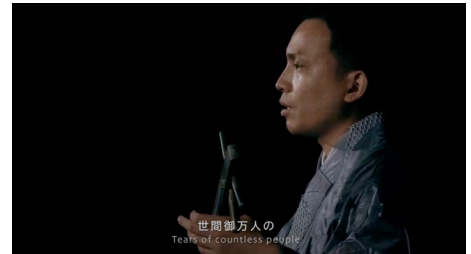
2. 《命ぬ御祝事さびら》2025 © Kento Terada, Courtesy of Yumiko Chiba Associates