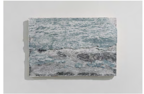
3. 《悠久を測る1》2024

1993年京都府生まれ。2018年京都市立芸術大学大学院美術研究科絵画専攻版画修了。主な展覧会に「Shake 西村涼・柳大輝 二人展」(準備中・五木、東京、2025)、「Putting life on paper / 光の種子を蒔く」(TAKU SOMETANI GALLERY、東京、2025)など。主な活動に「アーティスト・イン・レジデンス プログラム 2023 “starquakes”」(国際芸術センター青森)、主な受賞歴に「Kyoto Art for Tomorrow 2024 一京都府新鋭選抜展」朝日新聞社賞など。