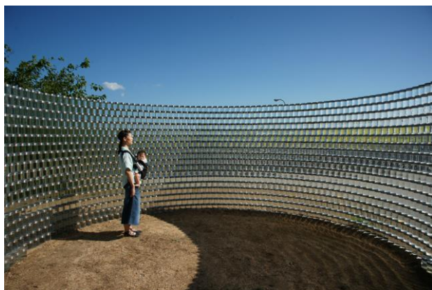
小松敏宏 《Sea Room》 2013、瀬戸内海で採取した海水 約 3000 個のガラス瓶、シリコン、コンクリート、瀬戸内国際芸術祭 2013