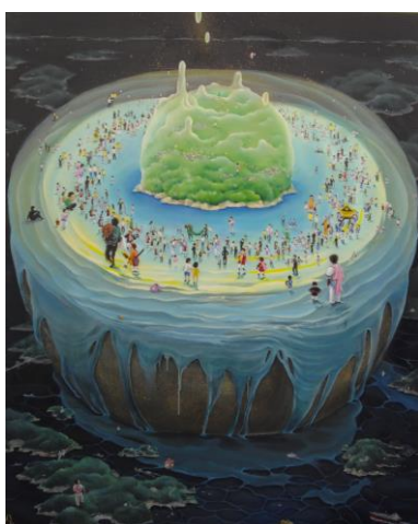
村上佳苗 《御手ノ真中》 2010、カンヴァス、油彩