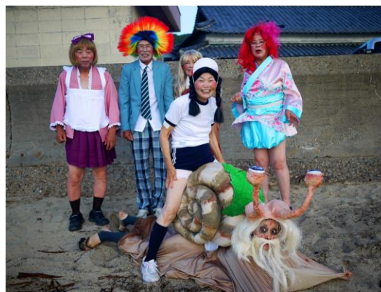
林千歩 《You are beautiful》 2011、ビデオ、絵画、立体など 小豆島 AIR アートプロジェクト「Story of the Island」展