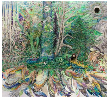
大小島真木 《星の歌》 2012 壁画（鉛筆、色鉛筆、クレヨン、紙、パネルに紙、鉛筆、アクリル）