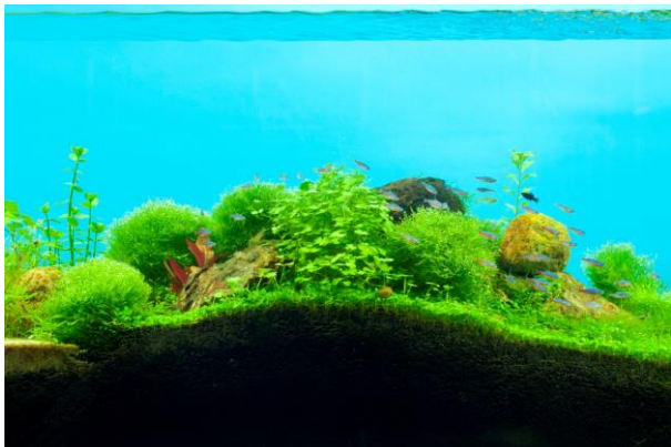
池田晶紀 《DOUBLE NATURE》 2011 ラムダプリント、アクリルマウント