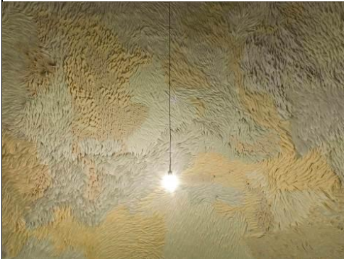
『ソング／もとのけもの、リズム』 (2013年青森公立大学国際芸術センター青森)

静かな部屋が見つかる。先に見つけて、羽根は、居心地の良い場所で仮死。 静かな部屋が随分前からうたってきたうたを聞きつけて。 「ささやかで、すぐには聞こえないから、遅れてきたあなたは、少し待って、 あなたを取り巻く夜が少しずつ明けるまで」 数万の羽根が作る濃密な静寂は、部屋が生まれたときから持つ固有の響きの 似姿です。その響きの中で聞こえてくる音は、あなたの似姿です。