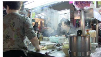
友政麻理子 《お父さんと食事》 2013、ビデオ