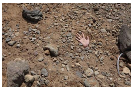
二藤建人 《山頂の谷底に触れる》 2013