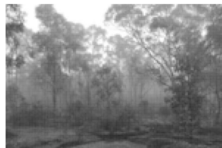
潘 逸舟 《オーストラリア》 2013、写真、3×2m