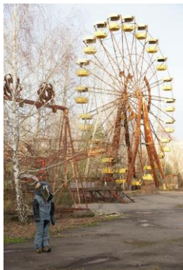
オル太 《ゴースト オブ モダン》 2013-2014、デ ジタルビデオ