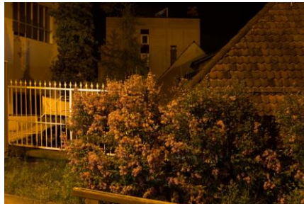
福居伸宏 《B' - 6957》2013、写真 © Nobuhiro Fukui, Courtesy of Tomio Koyama Gallery