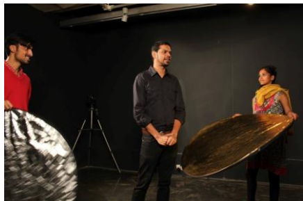
バリバルタナ・モハンティ 《Act the Victim》 2012、インド