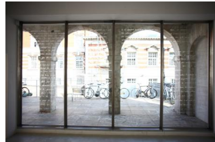
栗林 隆 《Invisible》 2013 コットンにプリント、ホットボンド、映像