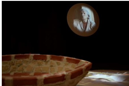
佐藤未来 《マニアーナ、new wave》 2013、映像、石、煉瓦、タイル、塩