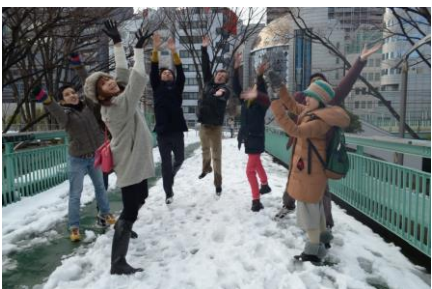
イルワン・アーメット&ティタ・サリナ 《AIR BALL》 2014