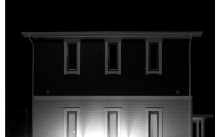
山本良浩 《Model house》2014、写真