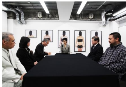
加瀬才子 《Life-time Project》2013、ミクストメディア