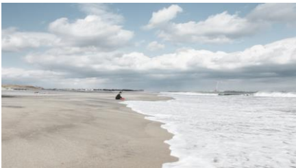
川久保ジョイ 《Anagrams: 'a haiku man cube fish'》2014 写真、紙、インク、切手、封筒