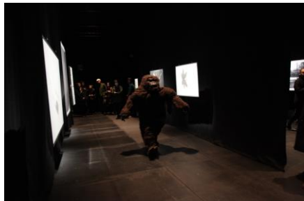
小沢 剛 F/T13 イェリネク連続上演 「光のない。(プロローグ?)」 作:エルフリーデ・イェリネク 演出・美術:小沢 剛 2013年11月21日~24日 東京芸術劇場シアターイースト(東京)