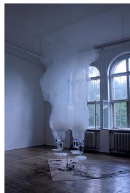
三原聡一郎 《 を超える為の余白》 2013