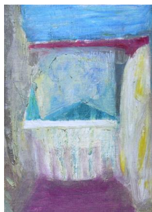
前川祐一郎 《untitled》2014 油彩、テンペラ、キャンバス 33.5×24.5cm