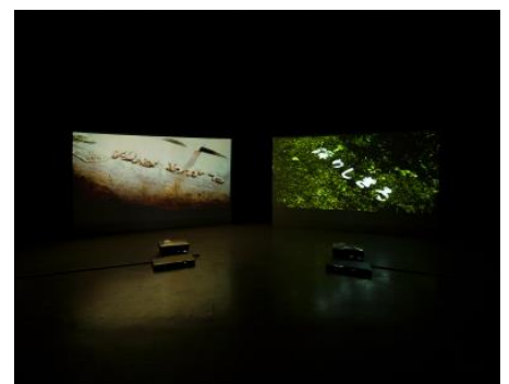
渡邊ひろ子 《Cycle》2013 ビデオインスタレーション サイズ可変