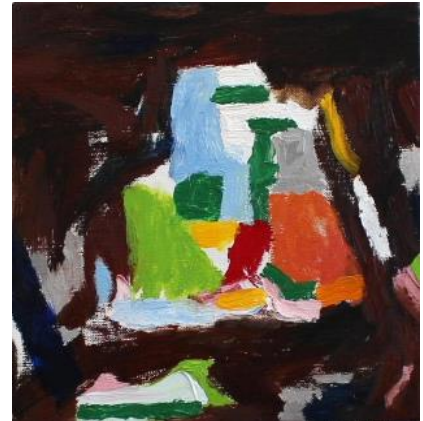
衣 真一郎《Block》2013 油彩、キャンバス 22.7×22.7cm