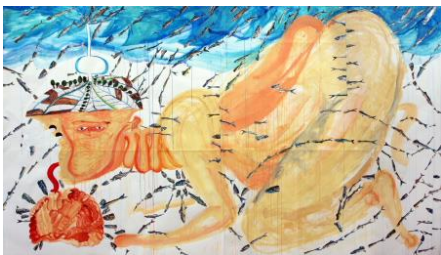
廣田真夕 《イワシになる》2013 アクリル、紙 250×450cm

1988年生まれ。2013年、女子美術大学大学院美術研究科修士課程美術専攻修了。近年の主な展覧会に「Progressive Maria 進行形のマリア」(早稲田スコットホールギャラリー、東京、2012)、「ウラオモテックス」(目黒区美術館区民ギャラリー一、東京、2012)、「Rinneplatz リンネプラッツ」(Gallery Conceal、東京、2012)、「女子美スタイル☆最前線 2009」(BankArt studio NYK、神奈川、2009)など。