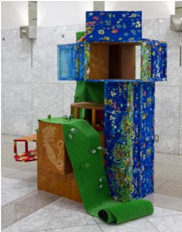
本田アヤノ《SUPER NATURE》2013 木材、布、その他 180×180×180cm

1987 年生まれ。2013 年東京造形大学絵画専攻卒業。2014 年現在、東京藝術大学大学院美術研究科在籍。近年の主な展覧会に個展「田園風景」(現代 HEIGHTS Gallery DEN&.ST、東京、2014)、「ジェロニモ」(TURNER GALLERY、東京、2013)、「Switchers3×3」(藍画廊、東京、2011)等がある。「ワンダーシード」(2012・2013)、「アートアワードトーキョー丸の内 2013」入選。