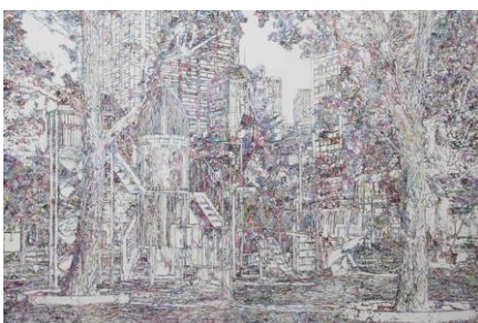
谷正也 《Virtual reality》2013 アクリル、パネル 130.3×194cm