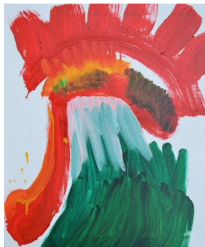
松田啓佑 《untitled》2014 油彩、キャンバス 72.5×61cm