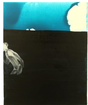
齋藤永次郎 《波殴り》2012 アクリル、キャンバス 91×73cm