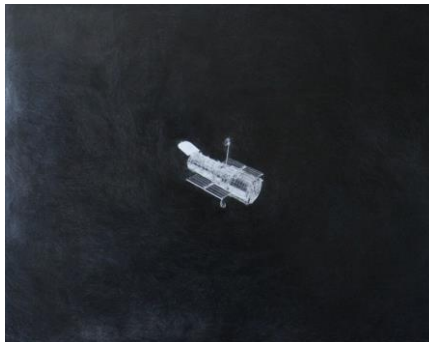
須藤美沙 《Hubble Telescope》2014 鉛筆、パネル