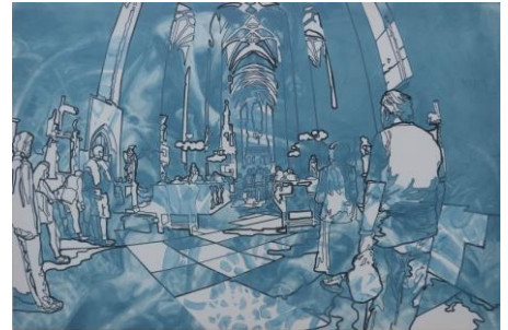
菅 雄嗣 《ぬり絵 其の一》2014 油彩、キャンバス、プリント