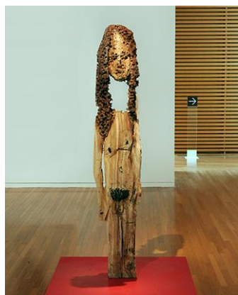
平川 正 《完璧な一日》 2012 木