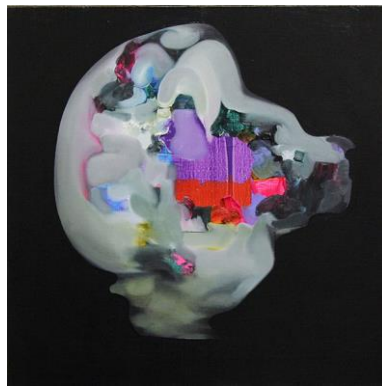
江川純太 《その瞬間、お前は何を捨てて何を拾うのだろうか?》2012 カンヴァス、油彩