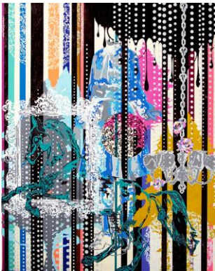
改田憲康 《Moon Beams》2012 パネル、アクリル