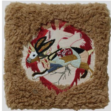
市川紗也子 《兎に角》2013 木枠、プリント生地、 刺繍糸