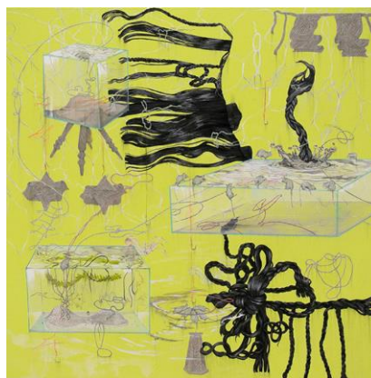
小林あずさ 《私は眠りを願わない》2012 パネル、綿布、 アクリル、鉛筆