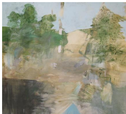
西村 有 《通りすがりの風》2013 カンヴァス、油彩