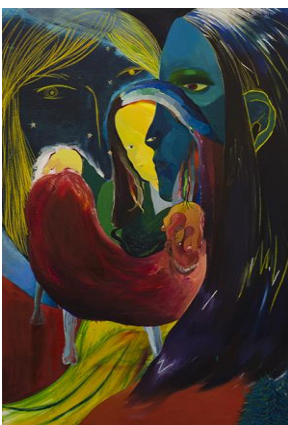
西村有未 《くらのげの皮と骨、流浪の民》2012 カンヴァス、油彩