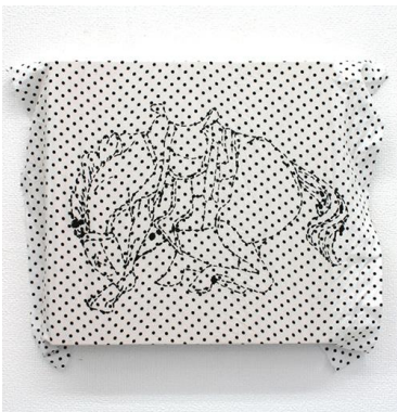
松井沙都子 《untitled》2012 パネル、プリント布 アクリル