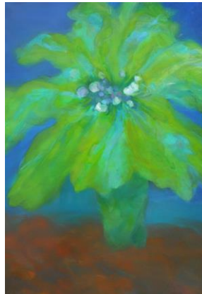
河合真里 《electric flower》2012 カンヴァス、油彩