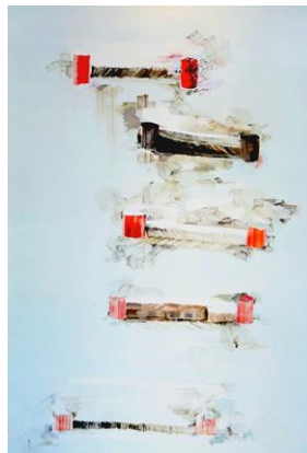
三瓶玲奈 《不親切なステップ》2012 カンヴァス、油彩