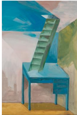
稲川 江梨 《階段》 油彩、キャンバス 2015年 トーキョーワンダーウォール賞