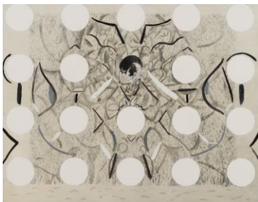
千原 真実 《Untitled》 油彩、鉛筆、キャンバス 2015年 トーキョーワンダーウォール賞