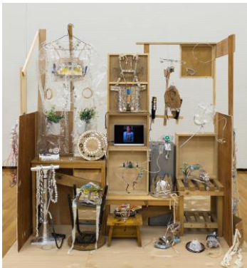
片貝 葉月 《感情纏身装身具／見世棚》 ミクストメディア、木、モーター、電池、セロハンテープ、 段ボール、針金、紙、ビニールパイプ、ねじ、ナット、 アルミホイル、ポンプ、銀紙 2015年 トーキョーワンダーウォール賞 審査員賞(山村 浩二)