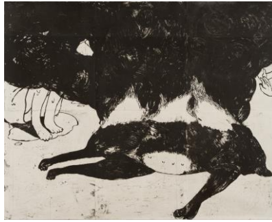
村上 早 《めぐらす》 銅版画 2015年 トーキョーワンダーウォール賞