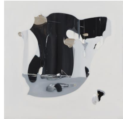
タナカ ヤスオ 《NO88 分岐時間》 oil on canvas 2015年 トーキョーワンダーウォール賞