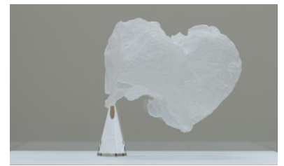
長沢 優希 《paradigm - shopping bag #2》 レジ袋、鉄、ガラス、アクリル 2015年 審査員賞(大巻 伸嗣)