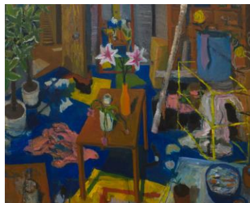
中尾 慶一郎 《部屋》 油彩、キャンバス 2015年 トーキョーワンダーウォール賞 審査員賞(丸山 直文)