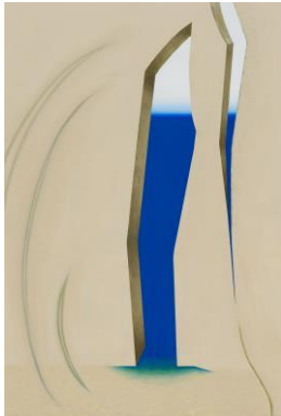
渡部 未乃 《外海》 油彩、アクリル、キャンバス 2015年 審査員賞(石原 慎太郎)