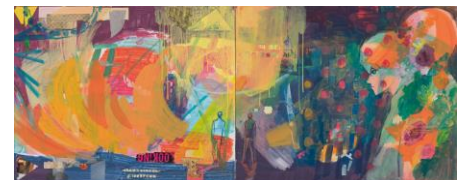
中野 奈々恵 《二時間半の永遠》 コラージュ、アクリル絵具、キャンバス 2015年 トーキョーワンダーウォール賞 審査員賞(杉戸 洋)