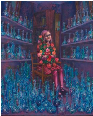
赤池 千怜 《アンネ・フランクに捧ぐ》 アクリル、綿布、パネル 2014年 審査員賞(鴻池 朋子)