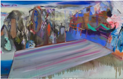
水上 愛美 《vision 4》 油彩、キャンバス 2014年 トーキョーワンダーウォール賞