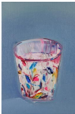
阿部彩葉子《グラス》2015