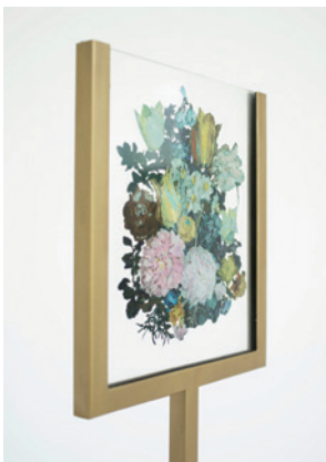
武田竜真《Skin Deep Beauty (No. 3)》 TAKEDA Tatsuma, Skin Deep Beauty (No. 3) | 2016

SUGITO Yoshie TAKEDA Tatsuma YOSHIDA Shingo and more