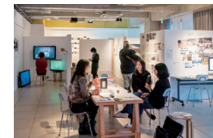
「オープン・スタジオ 2019-2020」 "OPEN STUDIO 2019-2020" | 2020

This program introduces the work or research of creators in residence at TOKAS Residency. It consists of explanation of work by the creators themselves, talk events with guest speakers and tours of the Residency facilities.