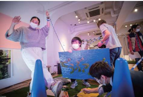
どうぶつえん「OPEN SITE 5『どうぶつえん in TOKAS 2021』」パフォーマンス風景 Doubutsuenzoo, Performance at "OPEN SITE 5 'Doubutsuenzoo in TOKAS 2021'" | 2021

This open-call program seeks to be a platform for work from the full range of arts-related genres. Innovative projects based in contemporary perspectives that aim to create completely new forms of expression are selected and implemented, along with TOKAS Recommendation Programs and the Art Mediation Programs.