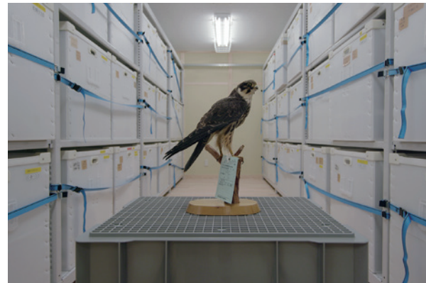
藤井光《核と物》FUJII Hikaru, Les nucléaires et les choses | 2019