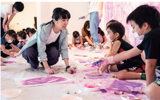
「夏のこどもワークショップ」2019 "Summer Kids Workshop," 2019

At TOKAS, we use multifaceted approaches to connect the arts audience with the artists, their works and creative activities by the artists and creators taking part in our programs. These include talks and workshops to deepen understanding of creation and works of art, using our archives to broaden the range of our audience, plus other online services, our e-mail Newsletter and Annual Report, etc., and many other efforts to provide places for creative activities to more and more people.