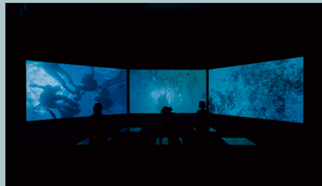
山城知佳子《肉屋の女》2012 YAMASHIRO Chikako, A Woman of the Butcher Shop , 2012