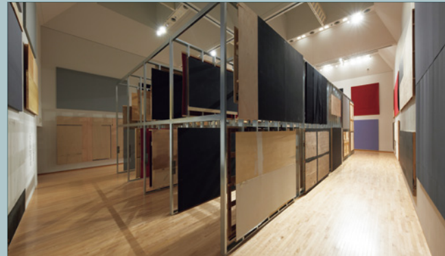
藤井光《日本の戦争画》2022 FUJII Hikaru, The Japanese War Paintings , 2022

2022.3.19 - 6.19 休館日：月曜日(3.21は開館)、3.22 Closed: Mondays (except 3.21), 3.22