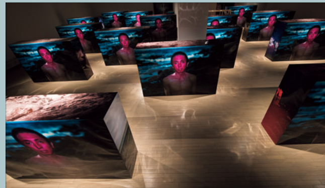
志賀理江子「ヒューマン・スプリング」展示風景 東京都写真美術館 2019 SHIGA Lieko, Installation view at "Human Spring," Tokyo Photographic Art Museum, 2019