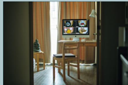
黒田大スケ《マッカーサー銅像ミーティング(オンライン)》2021 KURODA Daisuke, Meeting on McArthur statue(online), 2021

This exhibition shows works based on creative activities in residence by four creators in the TOKAS residency programs in 2021 (including online residency).