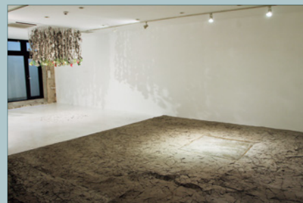
盧之筠(ルー・チーユン)《Stage 01》2014 LU Chih-Yun, Stage 01, 2014

This program seeks to promote thought on a variety of subjects and topics through multi-cultural perspectives. As part of an exchange program with the city of Taipei, a group exhibition is to be held primarily for the creators sent and received in this Exchange Residency Program.