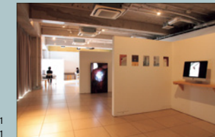
「オープン・スタジオ 2021-2022/12月」2021 *OPEN STUDIO 2021-2022/December, 2021

This program introduces the works or research of creators in residence at TOKAS Residency. It consists of oral presentations by the creators themselves, talk events with guest speakers and tours of the Residency facilities.