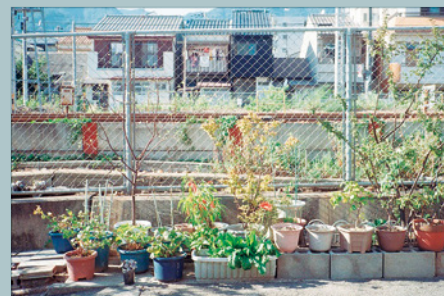
婦木加奈子 《ストレンジャー》2021 FUKI Kanako, STRANGER, 2021

トーキョーアーツアンドスペースレジデンス2022 成果発表展 TOKAS Creator-in-Residence 2022 Exhibition