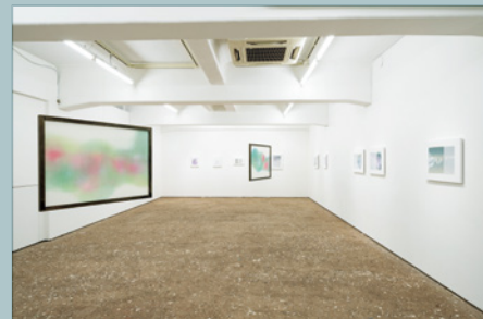
むらたちひろ 「internal works / 彼方の果」 展示風景 2022 MURATA Chihiro, Installation view at "internal works / kanata-no ka," 2022

Part 2 — 婦木加奈子、山田沙奈恵、時山 桜 FUKI Kanako, YAMADA Sanae, TOKIYAMA Sakura