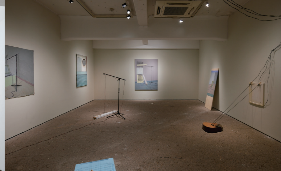
Rubén D'HERS 《From a Dusky Canal to the Pale Blue Sky》(進駐成果發表展2022) 展示風景 2022

透過與海外合作機構之間的兩城市間交流事業(派遣、招聘)，招聘海外創作者、研究駐村等的計畫，舉辦OPEN STUDIO及發表進駐成果的展覽等，促進國內外藝術家及藝術工作者的交流，同時廣泛宣傳其活動。希望藉由接納多樣藝術活動種類，成為各種人才交匯的據點。