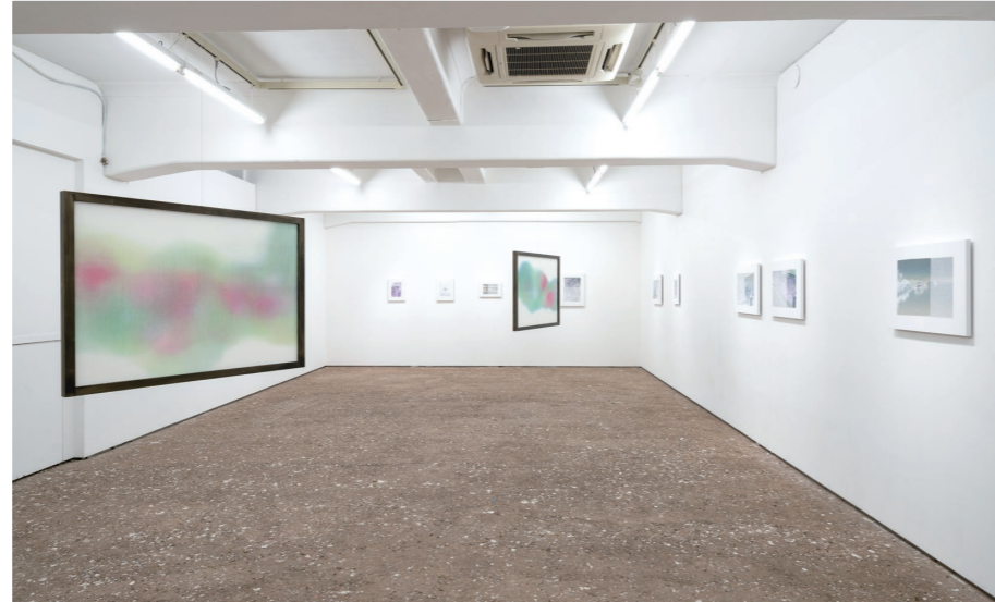
MURATA Chihiro 《Internal works / kanata-no ka》(TOKAS-Emerging 2022) 展示風景 2022

有提供新生代藝術家發表機會的「TOKAS-Emerging」，以參加TOKAS的事業，具備一定經歷之藝術家為主的群展「ACT」，及與東京都合作進行的「Tokyo Contemporary Art Award」等計畫來持續支援藝術家。