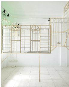
太田 遼《Inland Outside》(部分) 2022 OHTA Haruka, Inland Outside (detail), 2022