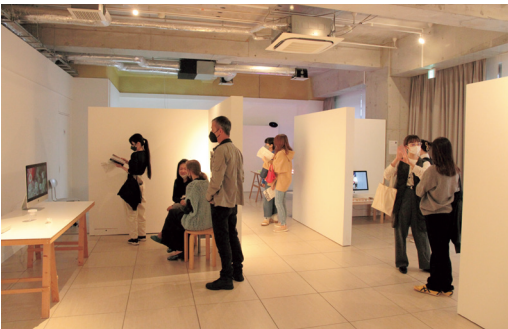
「オープン・スタジオ 2022-2023/11月」 2022

①2023.7.21-7.23 ②2023.11.17-11.19 ③2024.3.15-3.17