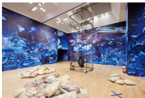
志賀理江子 展示風景 2023 SHIGA Lieko, Installation view, 2023

Open until 20:00 on Saturdays and Sundays from 5.13 to 5.28