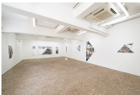
鮫島ゆい 「ACT Vol. 5『引き寄せられた気配』」展示風景 2023 SAMEJIMA Yui, Installation view at "ACT Vol. 5 'Ungraspable', " 2023