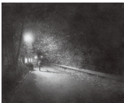
大東 忍《踊り場（秋田市檀山、December, 1963）》2022 DAITO Shinobu, Dance Floor , 2022