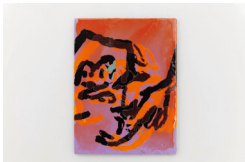
井上瑞貴《なかで、猫は伸びをして眺める#2》2022 INOUE Mizuki, Inside, a cat stretches #2 , 2022

Open-call exhibition program for young emerging artists