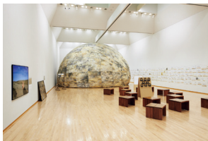
竹内公太 展示風景 2023 TAKEUCHI Kota, Installation view, 2023