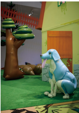
サエボーグ 展示風景 2024 Saeborg, Installation view, 2024

Venue: Museum of Contemporary Art Tokyo / Open: 10:00-18:00 / Closed: Mondays (except 4.29, 5.6), 4.30, 5.7 / Organizers: Tokyo Metropolitan Government and Tokyo Arts and Space / Museum of Contemporary Art Tokyo of the Tokyo Metropolitan Foundation for History and Culture