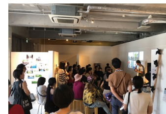
「オープン・スタジオ 2023-2024/7月」2023 “OPEN STUDIO 2023-2024/July” 2023

11:00-18:00 (金曜日は13:00-19:00) (13:00-19:00 on Fridays)