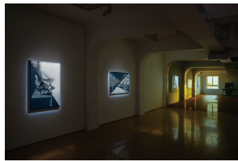
〈参考／Reference〉 菅 雄嗣「ACT Vol. 6『メニスル』」展示風景 2024 SUGA Yushi, Installation view at "ACT Vol. 6 'Layers of Optical Experience'," 2024