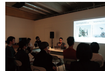
「キュレーター・トーク Vol. 1」2023 “Curator Talk Vol. 1” 2023

*Booking required / Conducted in English