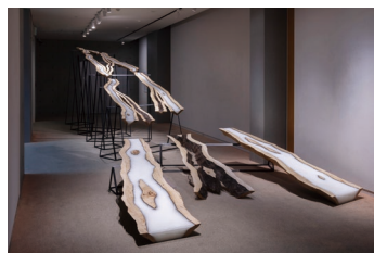
〈推奨プログラム／Recommendation Program〉 柄澤健介《道》2023 KARASAWA Kensuke, Road , 2023

Part 1: 2024.11.23-12.22 Part 2: 2025.1.11-2.9