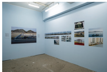
〈参考／Reference〉 ミシェル・ウノー「TOKAS Project Vol. 6 『風ぎ、揺らぎ、』」展示風景 2023 《イン・プログレス》2012-present Michel HUNEAULT, Installation view at "TOKAS Project Vol. 6 "Swaying Calmly, Gazing Quietly," 2023 In Progress , 2012-present